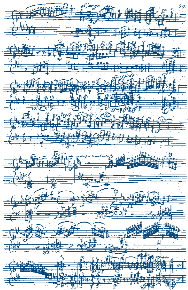
C. Ph. E Bach Fantasie c-Moll, Wq 63,6 – letzte Partiturseite (1753)

Das Sujet tonaler Modulationen – entlegene Tonarten, Verwandtschaftsverhältnisse – wird auf andere Parameter zu übertragen versucht. Konkrete Anleihen aus der Gattung der freien Fantasie sind an diesem Abend kontrastierende Extreme – die Dynamik, die Tonhöhen betreffend –, unvertraute Klangzusammenhänge, der (selbst-) bewusst-unbewusste Umgang mit Emotionalität, individuiertem Ausdruck. Aufnahmen / Live-Elektronik beziehen sich als Klangereignis verkehrt proportional auf die 'Fantasiermaschine', die durch eine ins Cembalo eingebaute Mechanik den Zeitablauf einer Fantasie aufzuzeichnen ermöglichte.